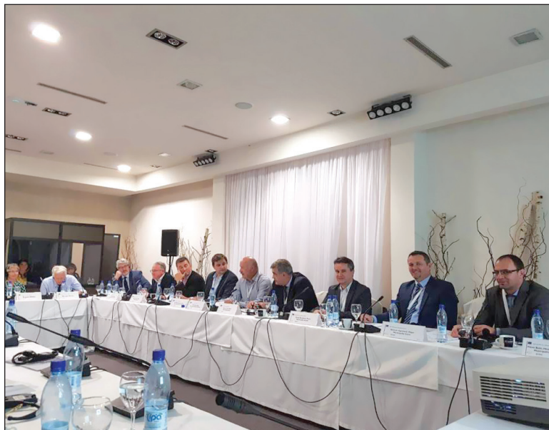
Na sastanku u Bihaću

Ova Komisija nema naredbodavnu, niti izvršnu funkciju.