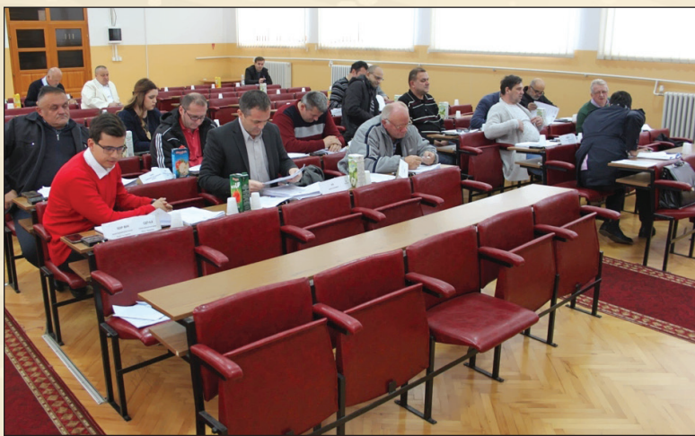
Na sjednici OV

Na samom kraju sjednice je usvojen prijedlog Rješenja o dodjeli građevinskog zemljišta pravnom licu iz Sarajeva.