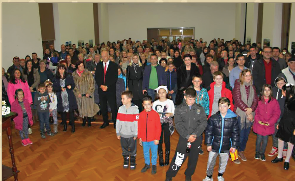
Dom kulture, Dan državnosti, 24.11.2017.

Za sljedeću godinu, kada se obilježava 75. godina od zasjedanja AVNOJ-a, dogovorena je još masovnija posjeta od strane ovih gostiju.