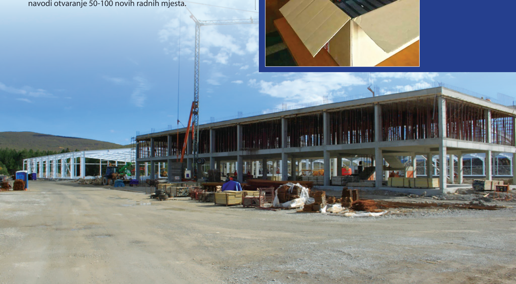
Gradilište Pirnara u poslovnoj zoni Gorinčani