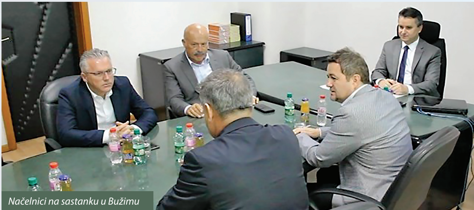
Načelnici na sastanku u Bužimu

Bilo je riječi i o nedavno donesenim Zakonima o državnoj službi i turističkim zajednicama, kao i o poslovnim zonama, te poboljšanju poslovnog ambijenta u Kantonu.