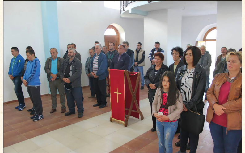
Na molitvi u mjesnoj crkvi

Druženje je nastavljeno uz domaćinsku atmosferu ispod šatora koji je postavljen nadomak crkve.