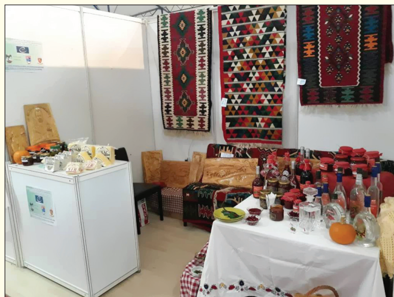
Izgled štanda ispred naše Opštine na „Jesenjem sajmu“

Učešće na banjalučkom sajmu je jedna od posljednjih aktivnosti predviđena ovim Projektom, a završni događaj promocije svih projekata koje je finansirao Savjet Evrope ove godine u BiH se očekuje u decembru u Sarajevu.