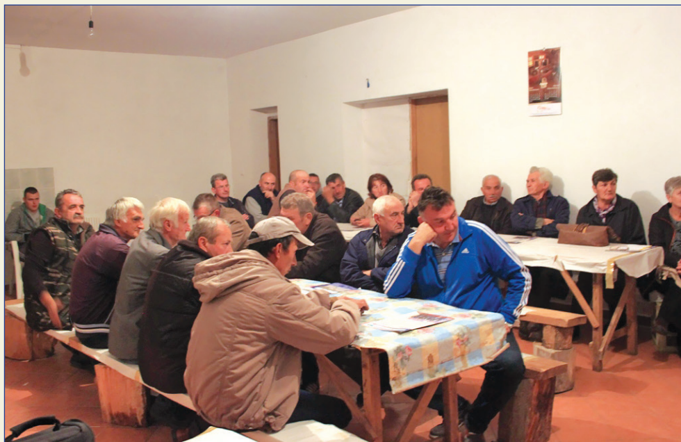
Mještani mjesnih zajednica na sastanku

Ovakvi sastanci će se nastaviti u svim mjesnim zajednicama, sa istim temama, sve do kraja godine.