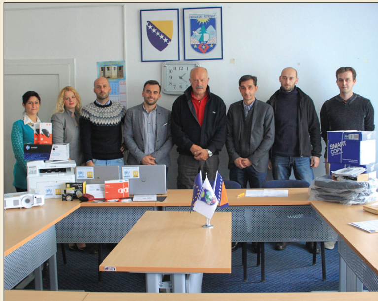
Prilikom preuzimanja donirane opreme

Također, u okviru HWA realizovana je komponenta ekonomske održivosti, kako bi radom sposobni stekli mogućnost za ekonomsko osnaživanje i ostvarenje prihoda, u vrijednosti od 22.000,00 KM.