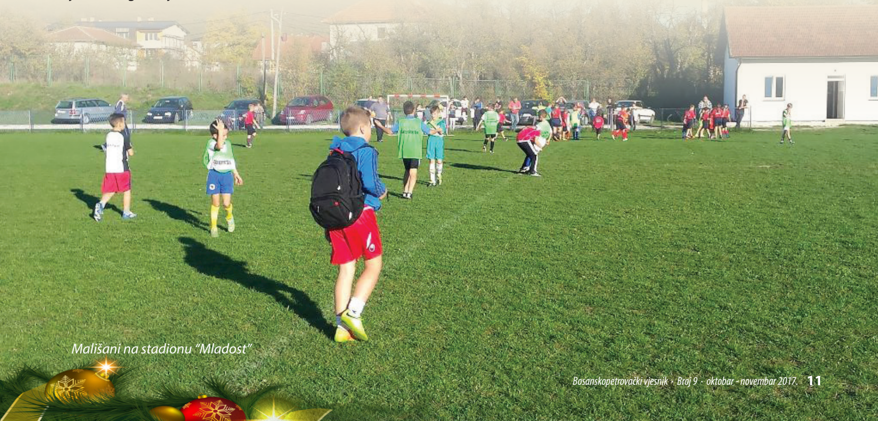
Mališani na stadionu „Mladost“