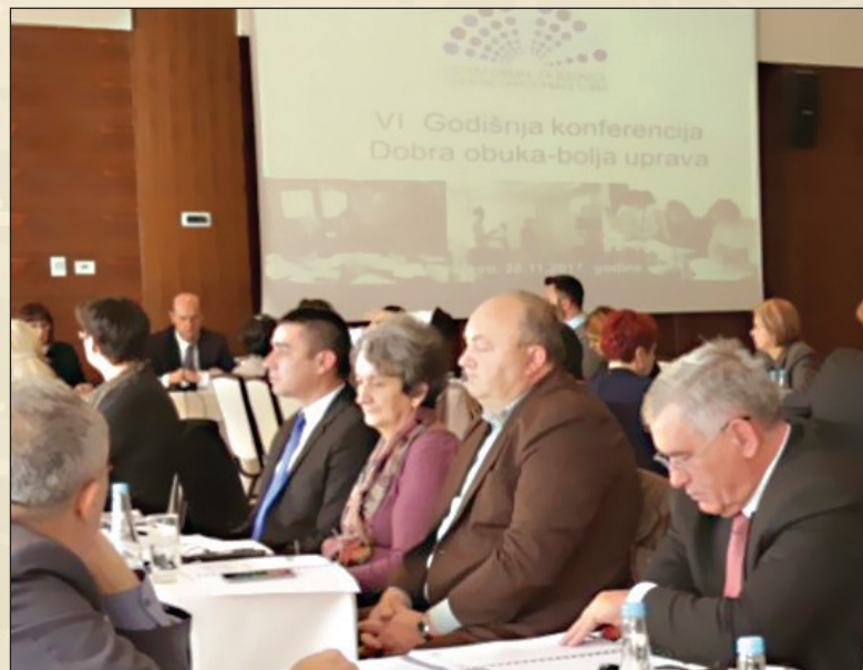
Konferencija "Dobra obuka-bolja uprava"

Na konferenciji je prisustvovalo oko stotinu sudionika, načelnici općina i gradonačelnici s prostora Federacije Bosne i Hercegovine, predstavnici kantonalnih ministarstava za pravosuđe/pravdu i upravu, predstavnici međunarodnih organizacija, te zvaničnici Agencije za isporuku integriranih usluga Albanije.