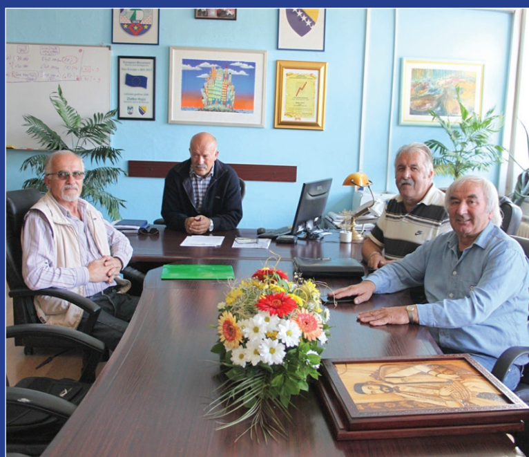
Na sastanku u Kabinetu načelnika

članovi društva, te je u tom smislu obećao nastaviti svaku moguću pomoć i podršku u njihovim aktivnostima.