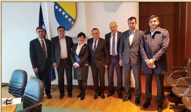
Na potpisivanju Memoranduma o saradnju sa iseljništvom

Za ovu saradnju je, za sada, predviđeno 10 zemalja.