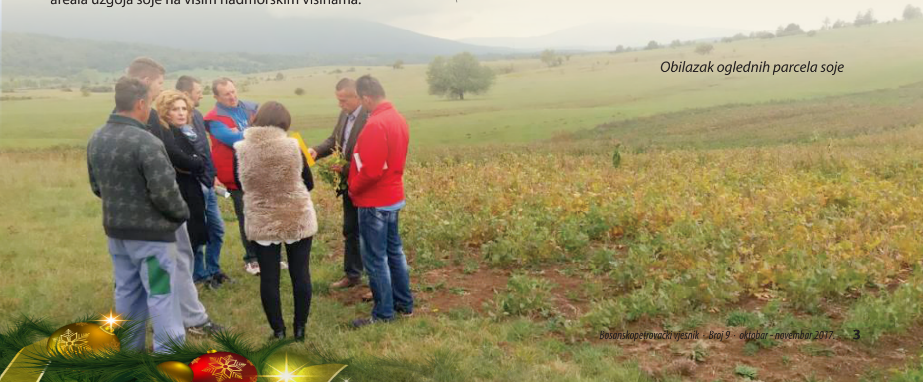
Obilazak oglednih parcela soje

Unsko-sanski kanton je prepoznat kao važan region u proizvodnji ove kulture, pa su se tako pored naše Opštine navedene aktivnosti provodile i u Bihaću, Cazinu i Sanskom Mostu.