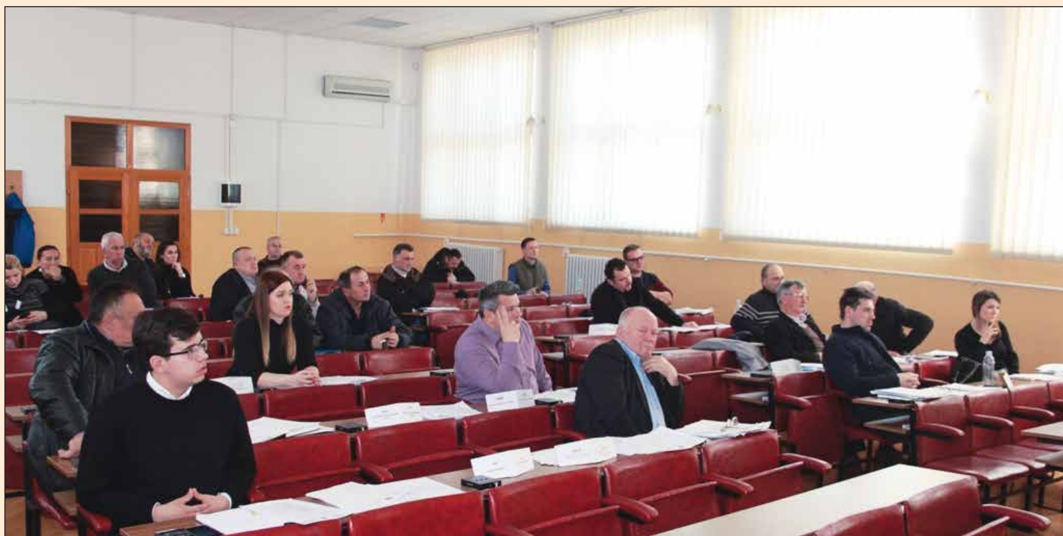
Sjednica Opštinskog vijeća

Na kraju je primljena k znanju Informacija načelnika o izvršenju zaključka Opštinskog vijeća.