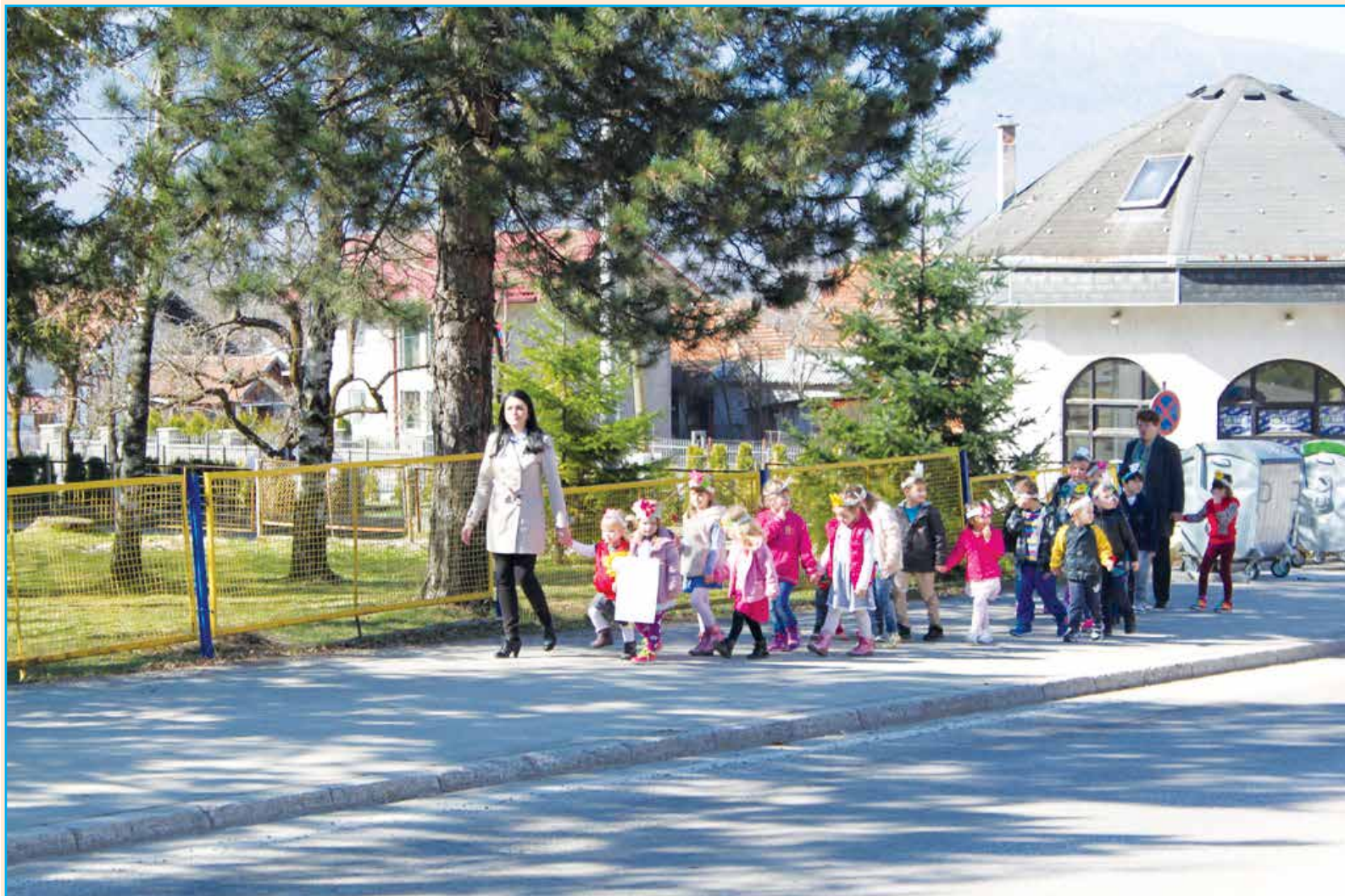
Mališani u šetnji...

Cilj ovakvih aktivnosti je da najmlađi pokažu šta znaju o ovom godišnjem dobu, da iskažu svoju kreativnost i sposobnost, a istovremeno da upoznaju i nauče sve ono što proljeće sa sobom donosi.