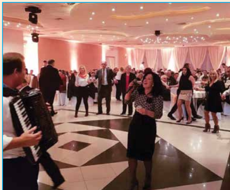
Atmosfera tokom druženja

Pjesma je odzvanjala do sitnih sati, a Petrovčani su sa velikim interesovanjem listali mjesečni bilten naše Opštine.