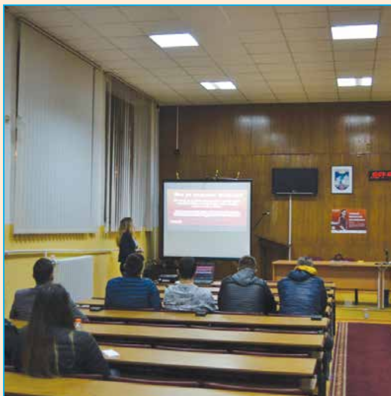
Prezentacija u Vijećnici...

U Bosanskom Petrovcu u periodu od 2012 do 2016. godine, kroz program Omladinske banke realizovan je 31 projekat, ukupne vrijednosti 93.739 KM.