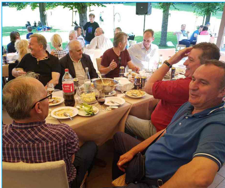
Na "Petrovačkom uranku"...

Potom, druženje se nastavilo u veselom tonu, uz pjesmu i ples, te ugodne razgovore zemljaka, čije je zajedništvo i saradnja garancija da im zavičaj nikada neće pasti u zaborav.