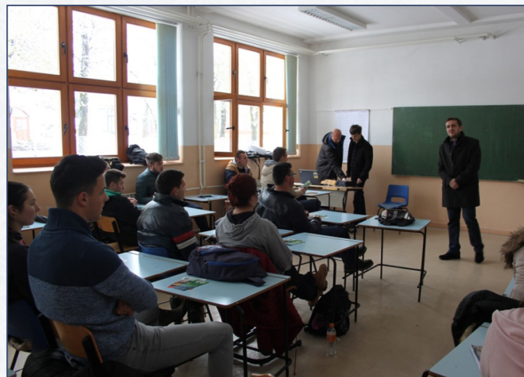
Prezentacija u srednjoj školi

Dokaz je ovo, još jednom, da naša Opština, zaista predstavlja kolijevku pametnih ljudi.