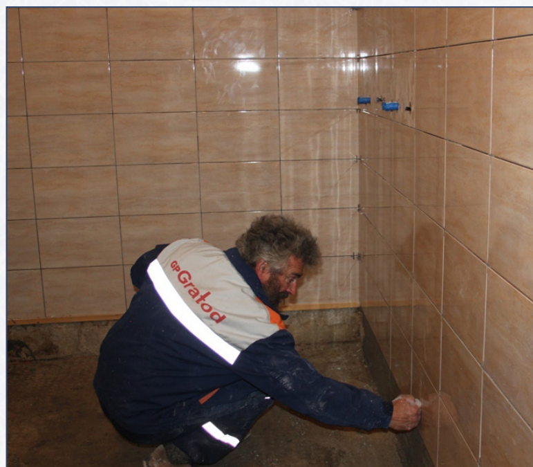
Radovi u toku...

i koji ima ulogu da okupi i animira mlade ljude, omogući im da se druže i takmiče, te razvijaju svoje tijelo i sportski duh.