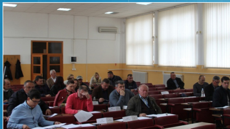
Sjednica Opštinskog vijeća

Tematska sjednica je, na samom početku dopunjena sa izmjenom Zaključka od 9.3.2017. godine, u kojoj se obavezuje Služba za obrt, poduzetništvo, razvoj i poljoprivredu da kvartalno informiše vijeće o aplikacijama na raspisani javni poziv, a ne po svakom objavljenom Javnom pozivu, kako je prvobitno odlučilo Opštinsko vijeće.