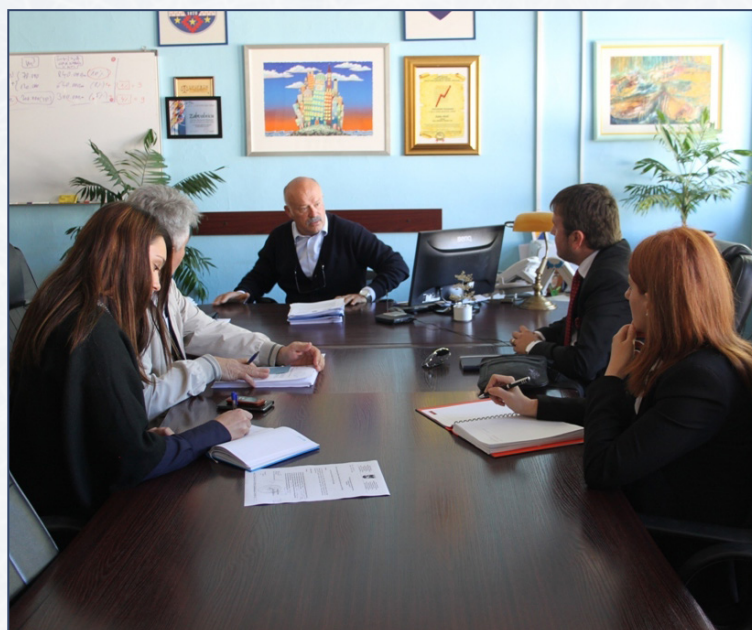
Na sastanku u Kabinetu načelnika

Naime, Razvojna agencija Unsko-sanskog kantona je Odlukom Vlade USK, 2014. godine imenovana kao nadležna institucija za vođenje Programa javnih investicija.