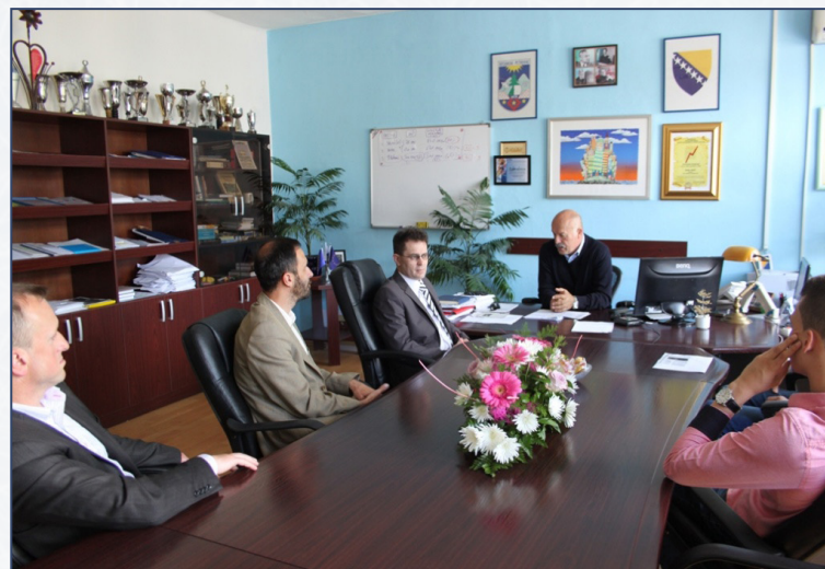
Predramazanski prijem kod načelnika