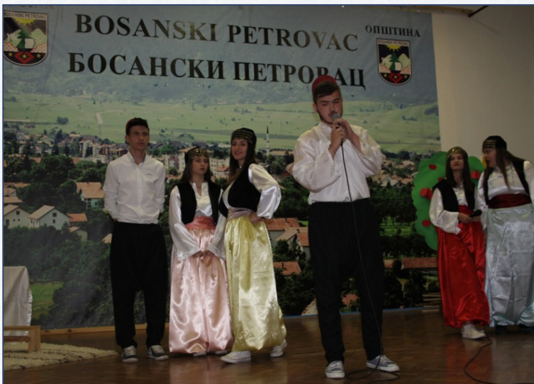
Gluma i pjesma...