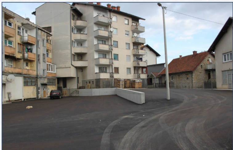
Svi zadovoljni novim izgledom parkinga

Dobivena sredstva Opština koristi, uz vlastito sufinansiranje, kako bi uredila i očuvala gradsku infrastrukturu, a sve u cilju funkcionalnijeg i ugodnijeg ambijenta za življenje svih građana.