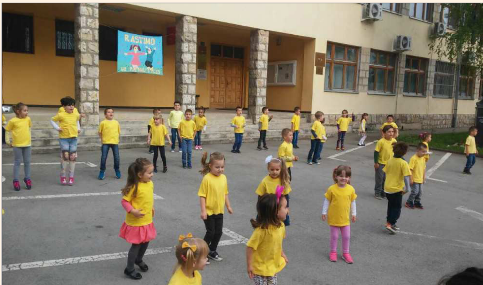
Naši najmlađi i najsladji...

Poželimo našim malim sugrađanima sretno djetinjstvo u njihovom Bosanskom Petrovcu uz što više pjesme, plesa i smijeha i zahvalimo osoblju dječjeg vrtića na krasnoj priredbi koju su nam priredili.