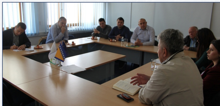
Sastanak u maloj Sali

Važno je istaći da je naša aplikacija jedina koja uključuje međuentitetsku i međuopštinsku saradnju.