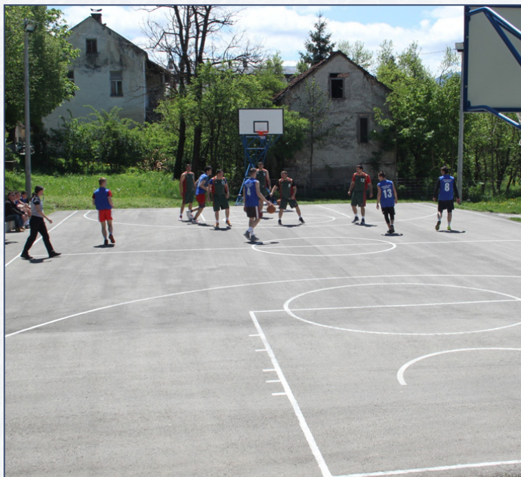
Utakmica na obnovljenom igralištu