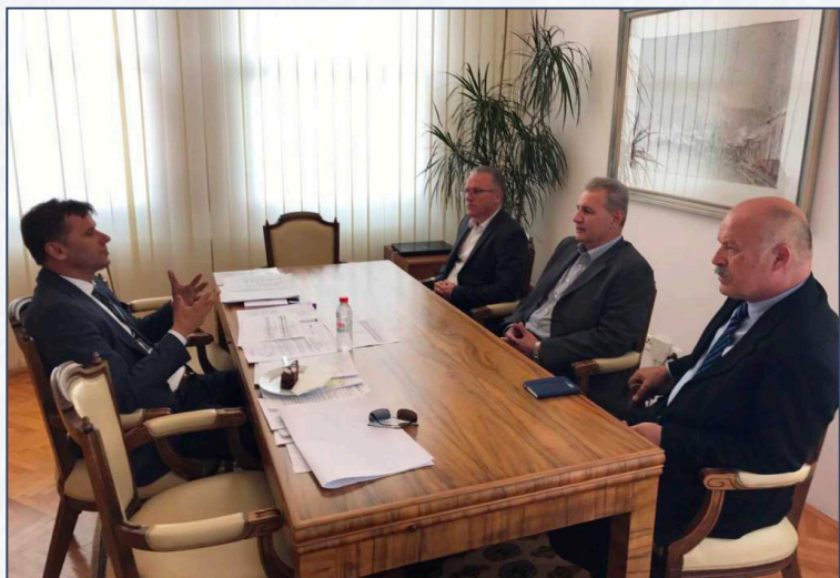
Na sastanku kod premijera Novalića

S druge strane, Arifagić navodi kako će zaposliti novih 300 ljudi, samo ukoliko mu se dozvoli da nesmetano radi i iskoristi postojeće kapacitete, s obzirom da je i u Bosanskoj Krupi slična situacija.