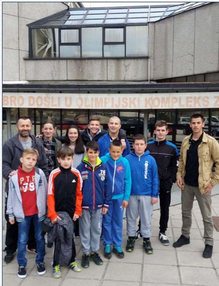
Rvački klub "Grmeč"

Ovo je odličan uspjeh naših takmičara. Ovakav rezultat posebno dobija na značaju kada se uzme u obzir da je većini naših takmičara ovo bio prvi izlazak na neki turnir.