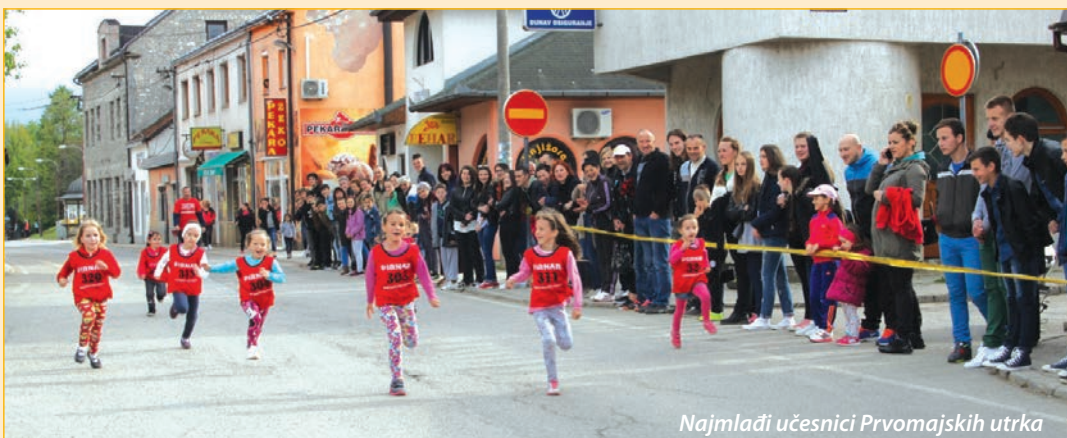
Najmlađi učesnici Prvomajskih utrka