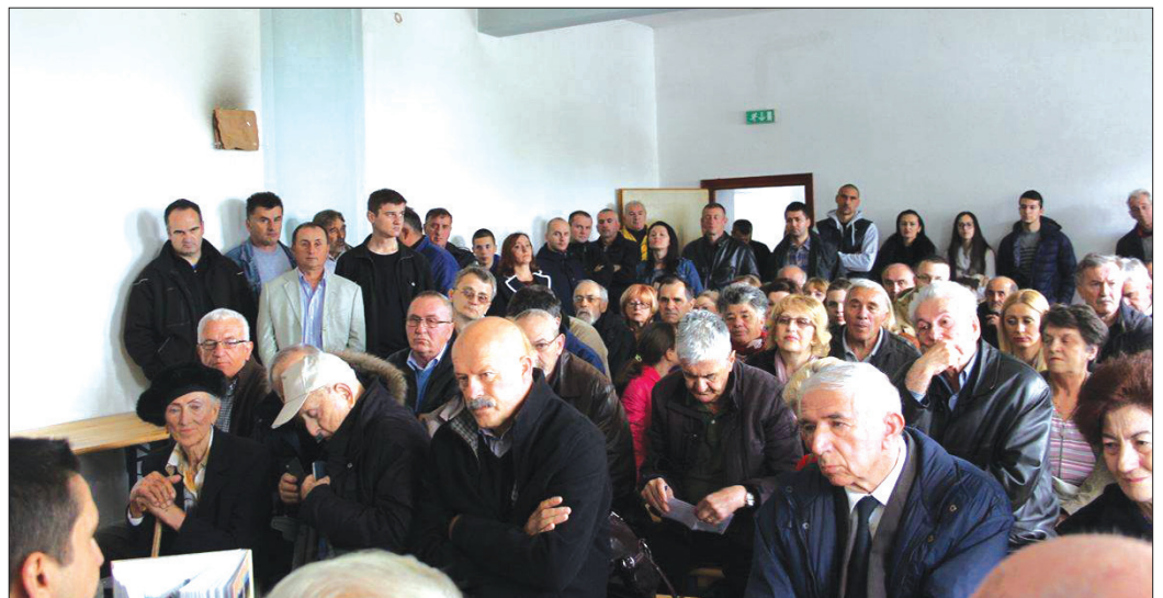
Promocija knjige u prostorijama mjesne škole Kolunić

Na kraju druženja, u Koluniću, autori su podjelili nekoliko knjiga, uz posvetu i najbolje želje prisutnima, uključujući i medije.