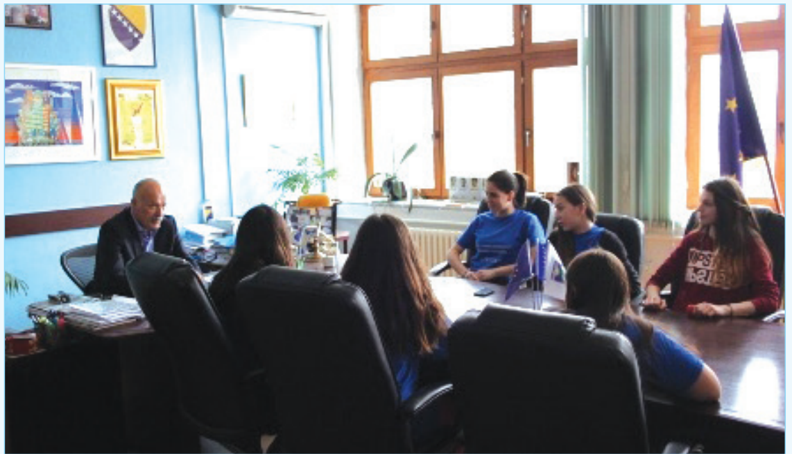
Članovi sekcije „Civitas“ u posjeti načelniku

Načelnik se saglasio sa mladim gostima i obećao punu podršku Općine u njihovom radu.