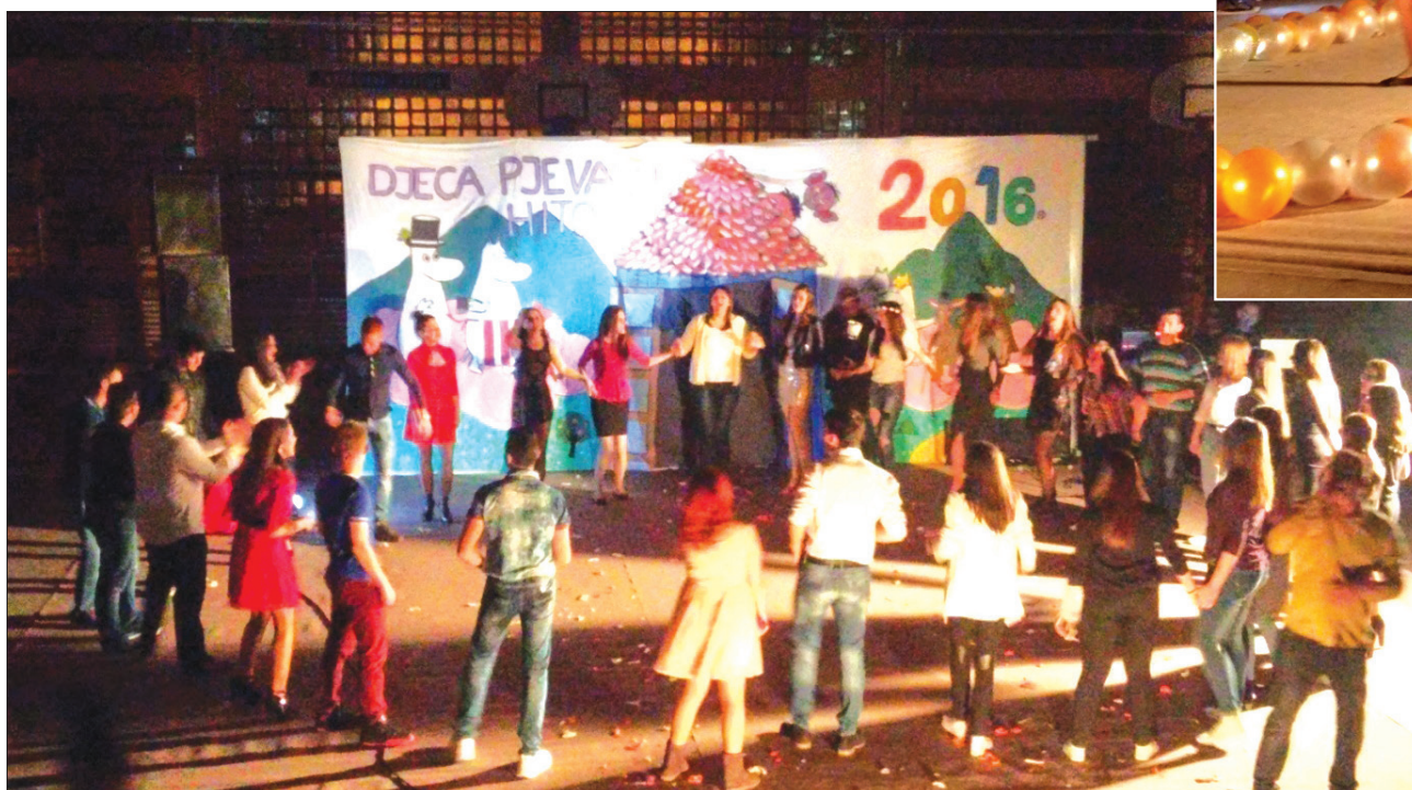
Festival je završen razdraganim kolom budućih maturanata