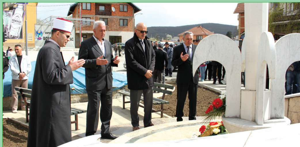
Polaganje cvijeća za Dan armije

Naredbom Predsjedništva od 23. juna 1992. Teritorijalna odbrana RBiH preimenovana je u Armiju Republike Bosne i Hercegovine, a 15. april je proglašen za Dan osnivanja ARBIH.