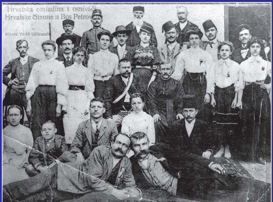
Otvaranje hrvatske čitaonice s početka prošlog stoljeća

Slušajte Radio Bosanski Petrovac od 15:00-17:00, svakim danom na 90.9 MHz fm