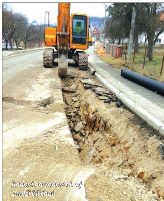
Radovi na vodovodnoj mreži Biščani