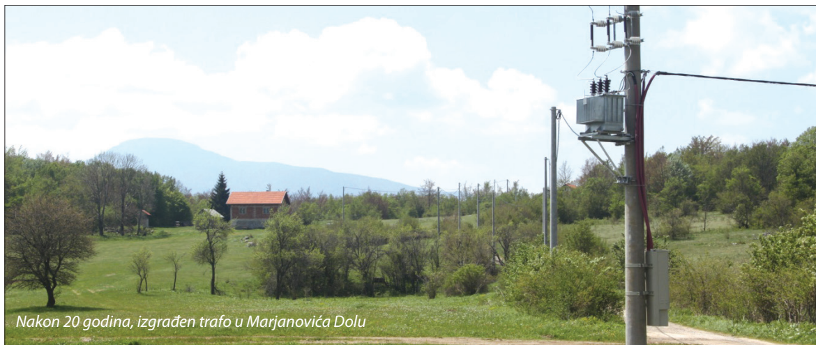
Nakon 20 godina, izgrađen trafo u Marjanovića Dolu