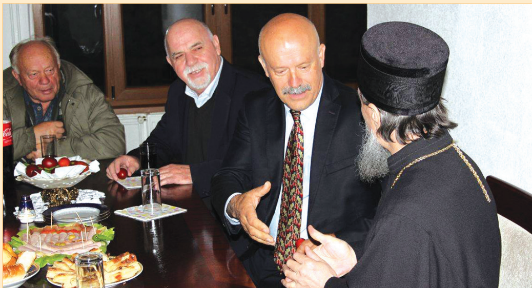
Općinski načelnik i vladika Atanasije na Vaskršnjoj proslavi

Poslije osvećenja vaskršnjih jaja, koje je Episkop podijelio vjernicima, vaskršnje praznovanje, uz pjesmu, nastavljeno je u prostorijama Eparhije, gdje se tradicionalno prekida četrdesetodnevni post, a kako tradicija nalaže, post se prekida tako što vjernici prvo jedu jaja, šarana na Veliki petak, a kao simbol života i novog rađanja.