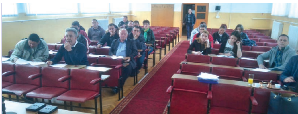
Sa sastanka „Projekt razvoja ruralnog poslovanja“, održanog u vijećnici

Informacije o tome ko i kako se može prijaviti za korišćenje sredstava iz „Projekta razvoja ruralnog poslovanja“ mogu se dobiti u Općini.