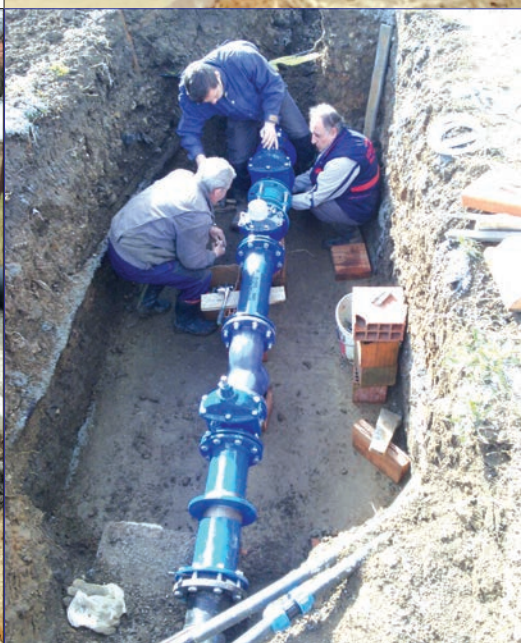
Radovi na kanalu F6-1