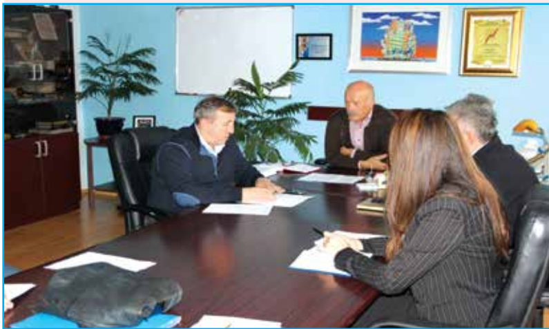
Na prijemu kod načelnika

Kroz tri godine očekuje se realizacija još projekata koji su vezani za razvoj ruralnog poslovanja.