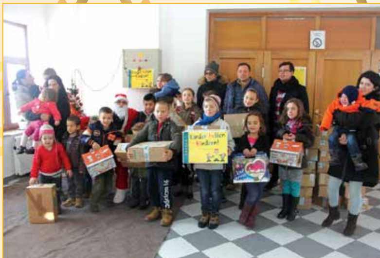
Podjela paketića u okviru Centra za socijalni rad, prva grupa...