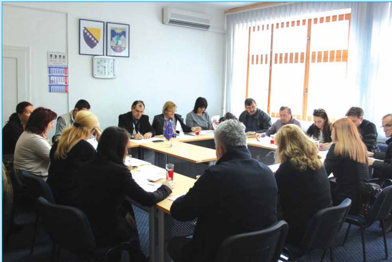
Općinski razvojni tim na radionici

Cilj izrade Strategije je definiranje zajedničkih ciljeva, podsticanje lokalnih snaga, ali i odgovor na izazove budućeg razvoja općine i sveukupnog života u njoj imajući u vidu da sve više domaćih i međunarodnih donatora kao jedan od uslova za apliciranje na potencijalne pozive zahtjevaju postojanje strateško-planskog dokumenta na nivou Općine.