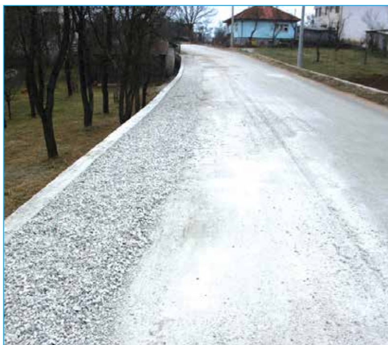
Sadašnji izgled zaobilaznice

Opština Bosanski Petrovac je za izgradnju izdvojila 20.000 KM, te ovim dokazuje činjenicu da se nastavlja uređenje, sanacija, te uspostavljanje okoliša dostojnog svakog građanina.