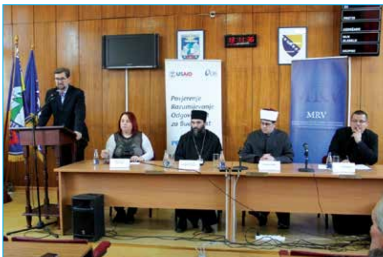
Uvodničari na tribini

Na kraju, upućena je jedna lijepa poruka iz Bosanskog Petrovca, koja se ne temelji samo na riječima, već na svakodnevnim djelima i primjerima iz života- „Svi smo kao jedno“.