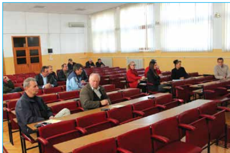
Učesnici obuke koja se održala u našoj Opštini

Sljedeće godine se očekuje nastavak aktivnosti, a o konkretnim detaljima znat će se tek na proljeće.