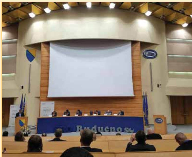
Predstavljanje platforme mira u okviru PRO-Budućnosti

Platforma za mir će tokom narednih mjeseci uz snažnu podršku Ministarstva za ljudska prava i izbjeglice BiH biti upućena Vijeću ministara BiH, a zatim i u Parlamentarnu skupštinu BiH. Načelnici šezdeset opština koji će potpisati Platformu postat će zagovarači, u tom za građane i narode BiH, neophodnom i ključnom procesu.