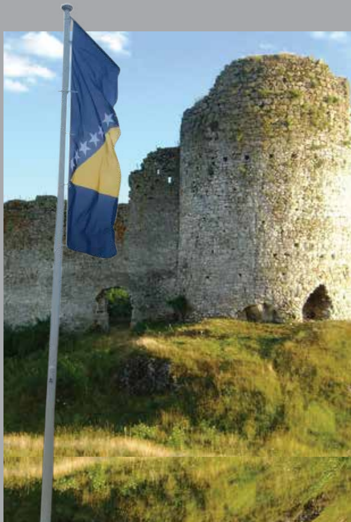
Zastava BiH kod Kule u Bjelaju

Kako je 7. marta 2007. godine Stari grad Bjelaj proglašen nacionalnim spomenikom, Vlada Federacije Bosne i Hercegovine bila je dužna osigurati sve pravne, naučne, tehničke, administrativne i finansijske mjere za zaštitu, restauraciju i prezentaciju nacionalnog spomenika. Međutim, već godinama se ništa nije učinilo po tom pitanju, pa ni postavljanje informacione table sa podacima o nacionalnom spomeniku.