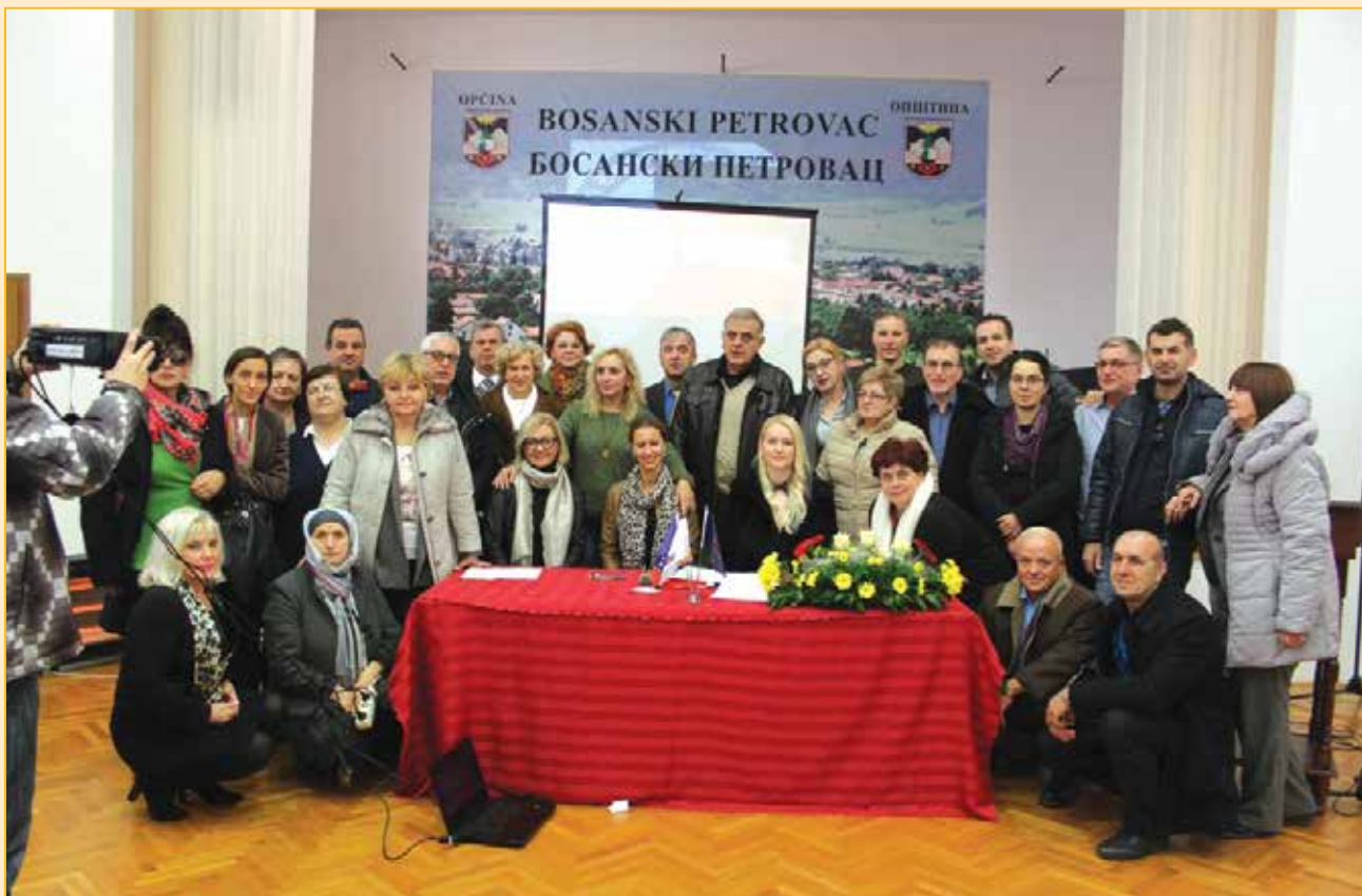
Zajednička slika pravobranilaca FBiH