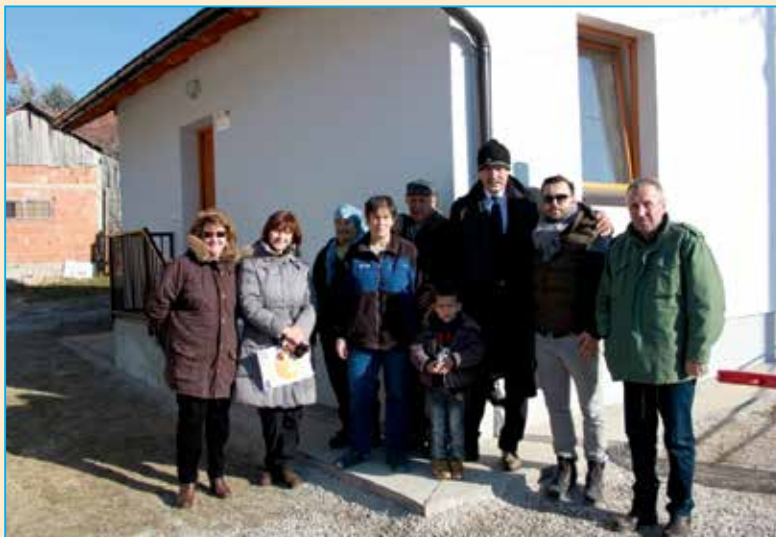
Porodica Redžić sa načelnikom, donatorima i izvođačima

HWA je, u saradnji sa opštinom Bosanski Petrovac, putem izgradnje i sanacije 9 stambenih jedinica sa pratećom infrastrukturom, podržao najugroženije porodice koje nisu imale minimum stambenih uslova, odnosno porodice koje su u potrebi za stambenim zbrinjavanjem pored čega je data i mogućnosti za samozapošljavanje i ostvarivanje prihoda, kroz dodjelu pojedinačnih grantova.