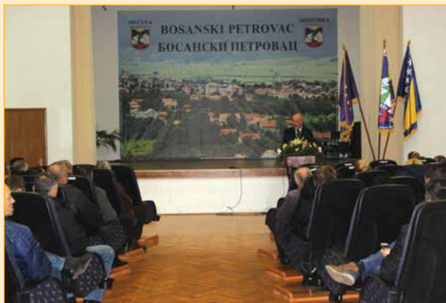
Obraćanje načelnika Hujića na novogodišnjem prijemu

Nakon obraćanja, prigodne čestitke povodom novogodišnjih praznika, uslijedilo je druženje.