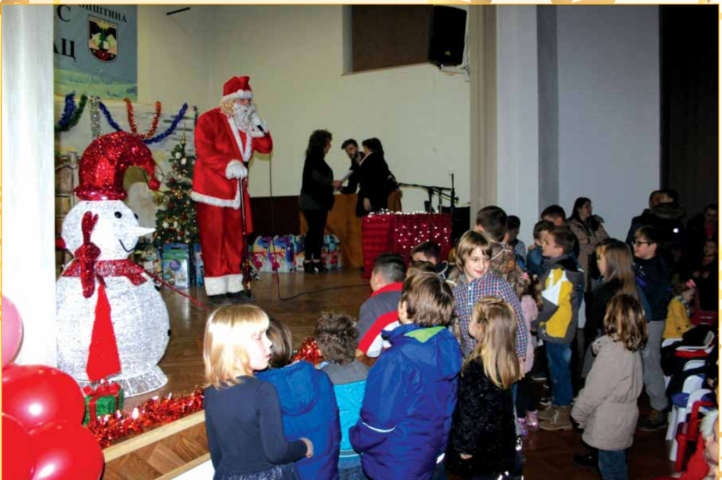
Podjela paketića u okviru sindikalnih organizacija

Isto tako, podjela novogodišnjih paketića organizovana je i od strane Centra za socijalni rad „Bosanski Petrovac“, u saradnji sa Adrom čiji je predstavnik Let's do it, i bosanskopetrovačkom firmom Mell plast. Paketići su bili namijenjeni za djecu koja su na evidenciji Centra za socijalni rad.