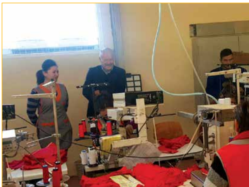
Tokom posjete načelnika Hujića

Na kraju, sve ovo je pokazatelj da na bosanskopetrovačkom tlu dolazi do ekonomskog razvoja i boljeg života.