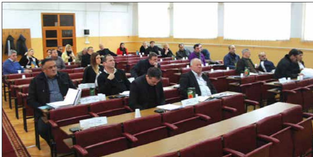
1. vanredna sjednica Općinskog vijeća

Iako zakon nalaže da je u ovakvoj situaciji sasvim opravdano i neophodno da vijećnici po inerciji, budući da se sve tri odluke uzajamno prožimaju, usvoje i treću predloženu Odluku o privremenom finansiranju Općine do marta 2017.