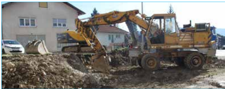
Parking- u toku radova

Izvođač radova bio je Dival Sanski Most, a nadzorni organ je firma IG Banja Luka.