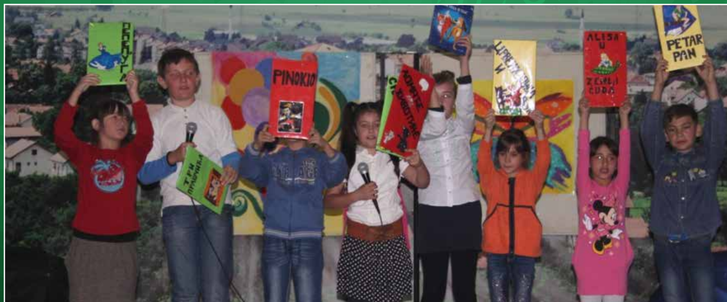
Učenici područne škole Bravsko i igrokaz "Od korice do police"