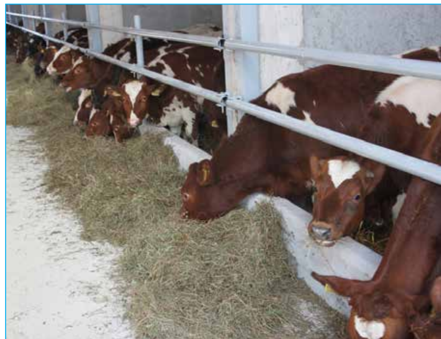
Krave na farmi „Fana-Arifagić“