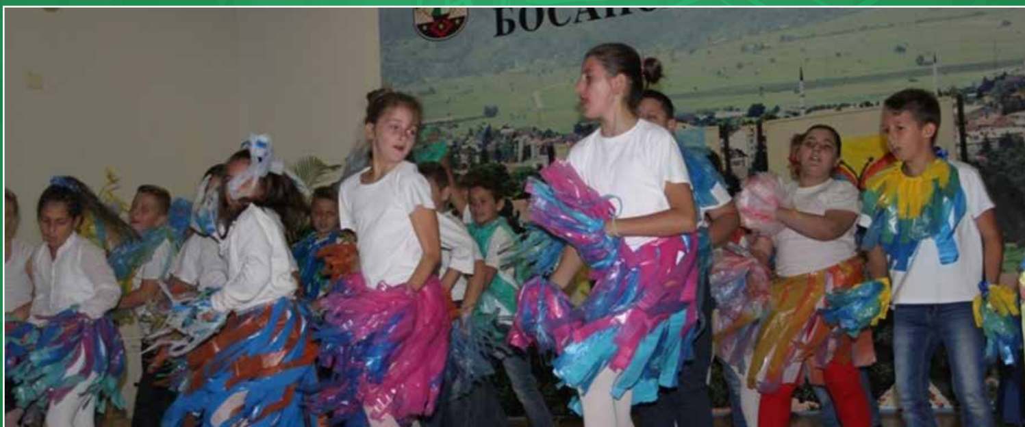
Učenici uz ples pokazuju svoju kreativnost