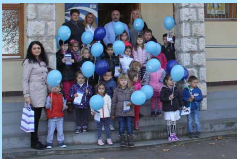
Obilježavanje Dana štednje, vrtićki mališani...

Štednja znači čuvanje vašega novca, istaknuto je na ovom događaju, da bi ga kasnije potrošili za nešto što vam je potrebno. Svi trebaju štedjeti kako bi imali za životne potrebe. Vesela djeca su s puno radosti obećala da će štedjeti i čuvati novac.