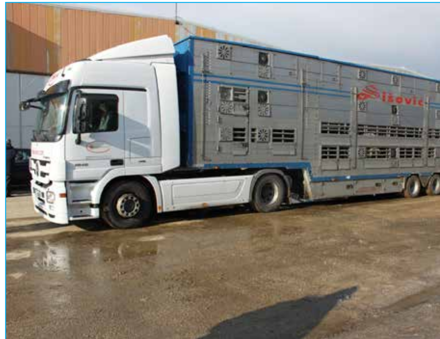
Dolazak krava na farmu...