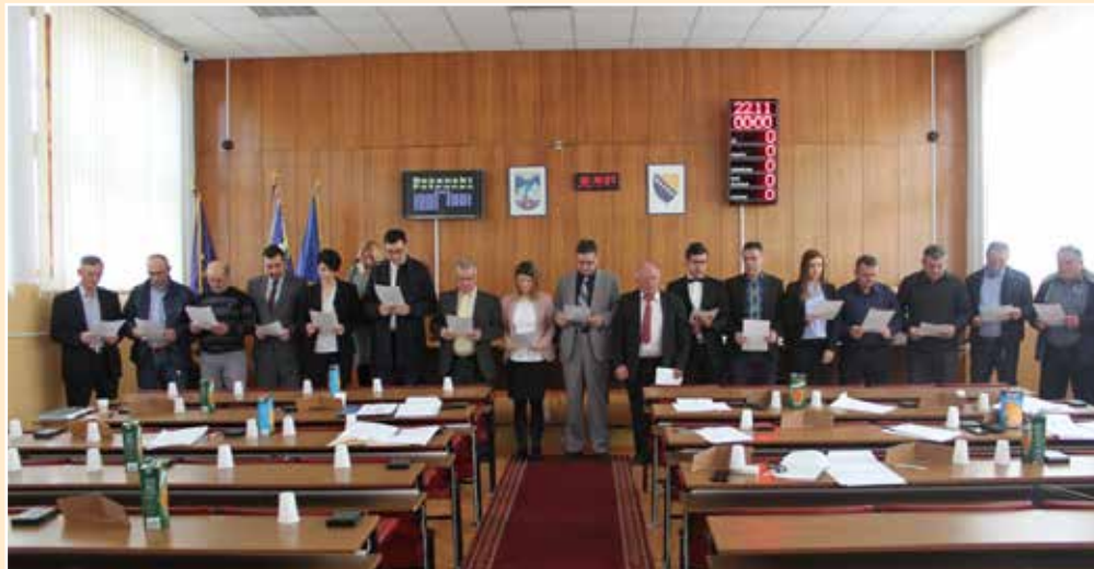
Polaganje svečane zakletve novog saziva Opštinskog vijeća

Sjednicu je nastavila voditi predsjedavajuća novog saziva, koja je zaželjela sretan i konstruktivan rad novog saziva vijećnika.