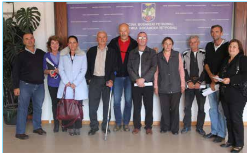
Zadovoljna 4 korisnika sa načelnikom ( u sredini) i predstavnicima FMROI- a ( prvi s lijeva i treća s lijeva)