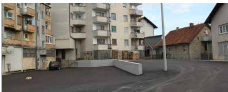
Izgled parkinga nakon radova