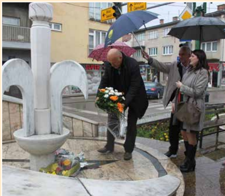
Delegacija Opštine polaže cvijeće na Trg šehida

Povodom manifestacije, gledaoci su mogli na RTV USK i RTV reportažu dokumenata i sjećanja, a sutradan je bila i upriličena Svečana akademija u Kulturnom centru u Bihaću, dok je prije svečanog dijela organizovano polaganje cvijeća na mezarju Humci, obilazak kasarne Adil Bešić, i džuma namaz.