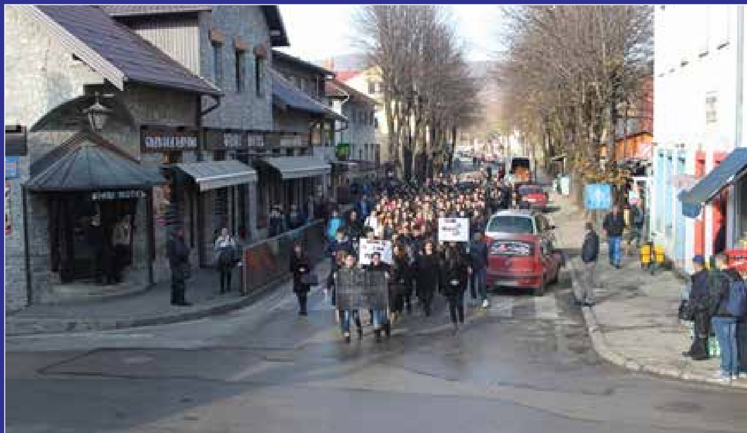
Povorka srednjoškolaca ka centru grada

Inače, Međunarodni dan srednjoškolaca obilježava se širom Bosne i Hercegovine. Na ovaj dan, predstavlja se važnost srednjoškolaca, kao budućih nosilaca kompletnog društva.