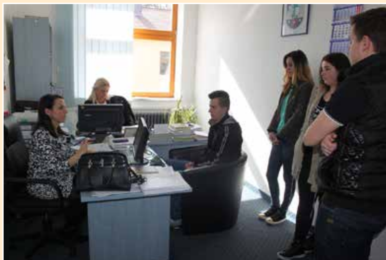
Učenici srednje škole u posjeti Opštini

Cilj posjete, ali i same prakse je da se učenici osposobe da budu odgovorne, nezavisne, kreativne i poduzetne ličnosti, a zadatak opštinskog organa je da aktivno učestvuju i pruže im u tome što veću podršku.