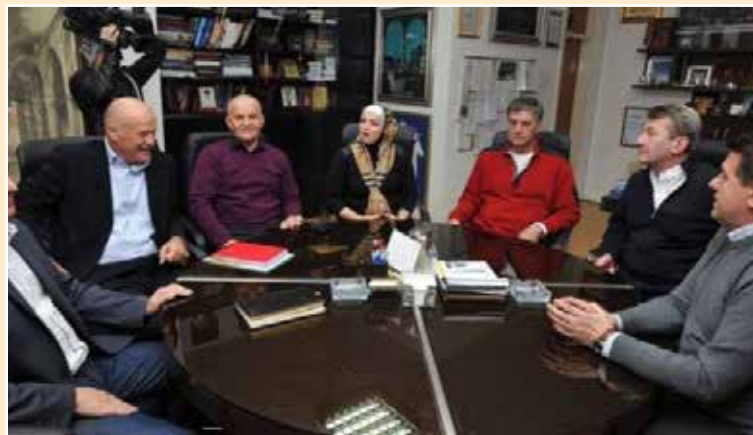
Nezavisni načelnici na sastanku u Sarajevu

Načelnici i gradonačelnici su zaključili da svi oni koji su na pozicijama moraju raditi u interesu građana, bez obzira da li pripadaju ili ne pripadaju nekoj političkoj opciji.