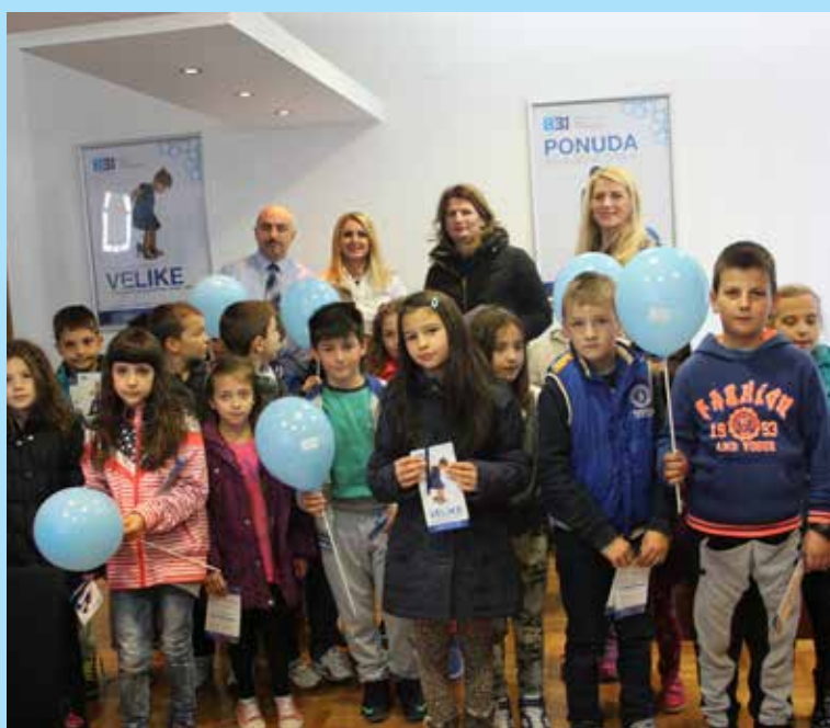
...učenici Osnovne škole

“Od kolijevke, pa do groba- najljepše je...”