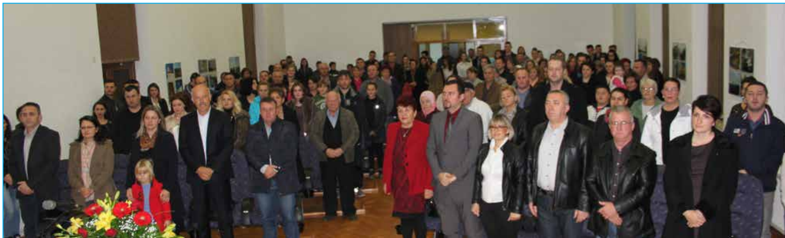
Publika u Domu kulture na akademiji povodom Dana državnosti

Svečanosti su prisustvovali vijećnici, ostali predstavnici kulturnog i javnog života, i brojni građani naše Opštine.