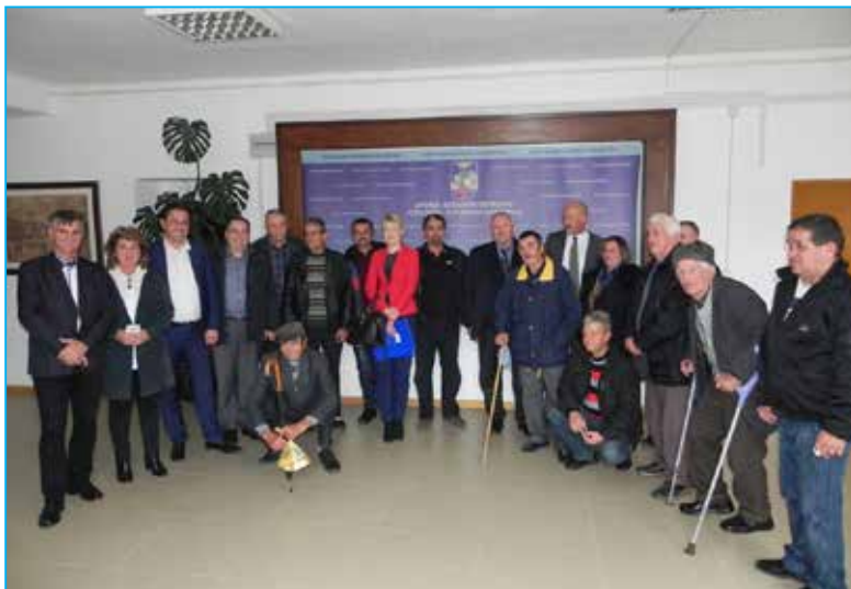
Zadovoljni korisnici sa načelnikom i ministrom Davorom Čordašom ( lijevo od načelnika)

Na radost svih onih koji su u stanju potrebe saradnja se i dalje nastavlja, Ministar je spomenuo skoro izgradnju zgrade od 20 stanova u našem gradu: „Mi zajednički radimo mnogo projekata, pored ovog postoji i Regionalni stambeni program koji će u Opštinu Bosanski Petrovac donijeti zgradu od 20 stanova“, završne su riječi ministra Čordaša.